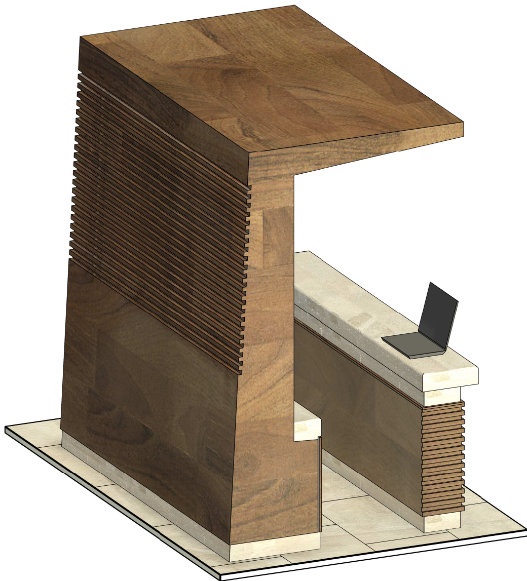
3 INTERIÉR RECEPCIA 3D II