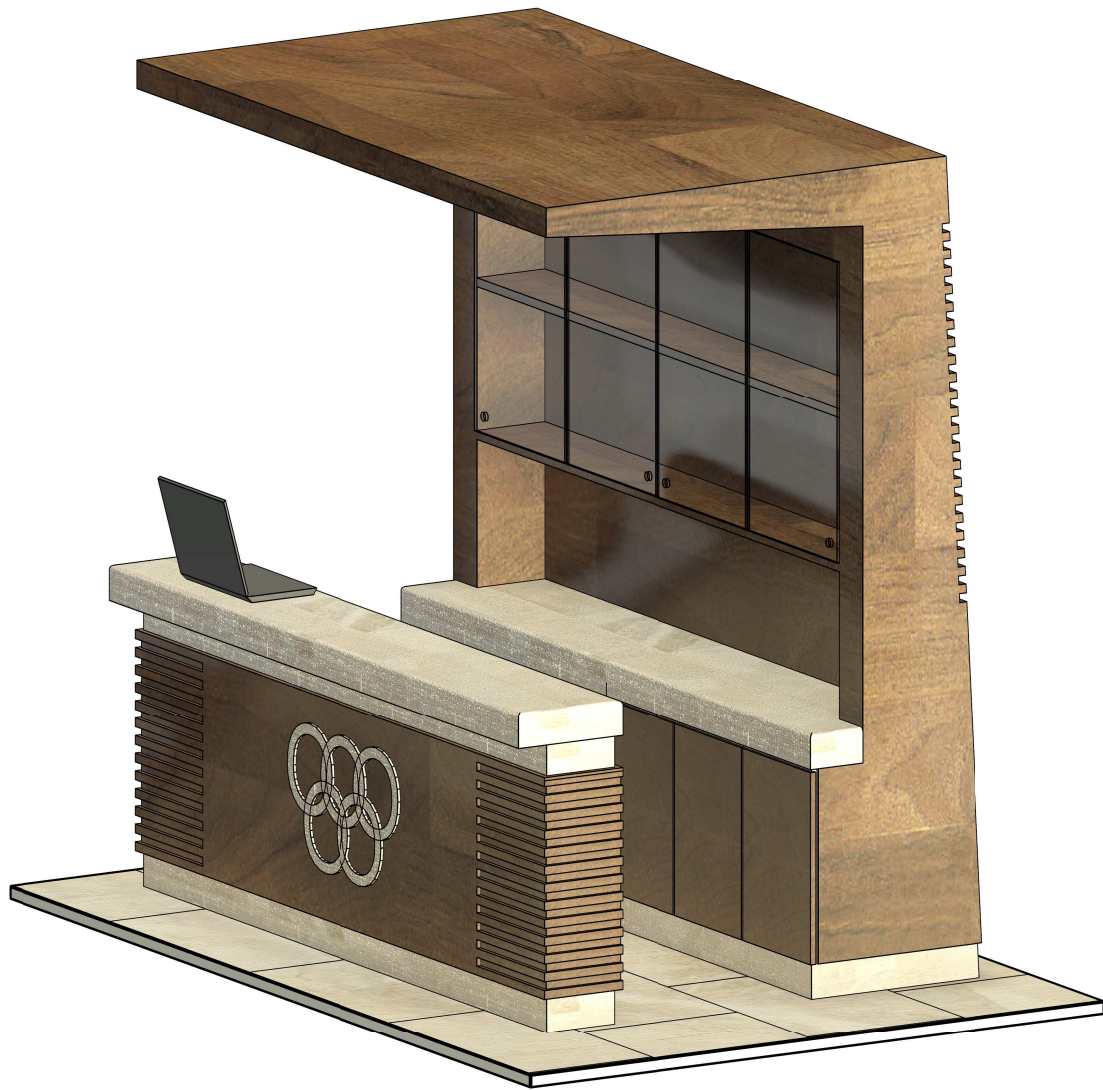
2 INTERIÉR RECEPCIA 3D